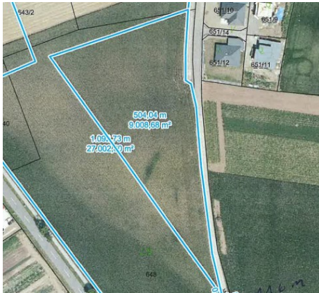
Teil der Parz. 648: